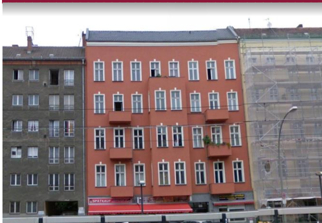
Petersburgerstr. 40, 10249 Berlin

DBC Finance GmbH Hirtenweg 14 82031 Grünwald