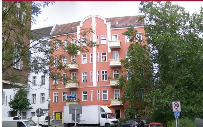
Sprengelstr. 2, 13353 Berlin

Telefon +49(0)89 20 60 313-0 Telefax +49(0)89 20 60 313-400 E-Mail info@dbcfinance.de