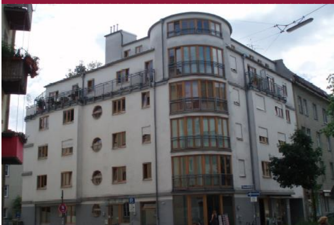
Schwanthalerstr. 155, 80339 München

DBC Finance GmbH Hirtenweg 14 82031 Grünwald