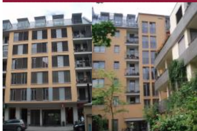
Hohenzollernstr. 72, 80801 München

Telefon +49(0)89 20 60 313-0 Telefax +49(0)89 20 60 313-400 E-Mail info@dbcfinance.de