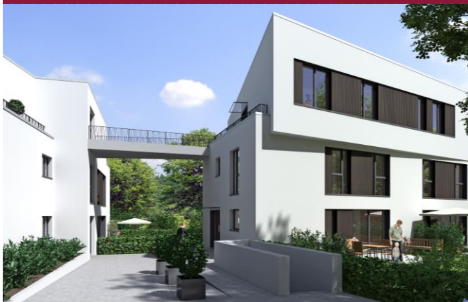
Poppenbüttler Landstr. 12, 22391 Hamburg

DBC Finance GmbH Hirtenweg 14 82031 Grünwald