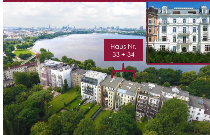
Schwanenwik 33 + 34, 22087 Hamburg

Telefon +49(0)89 20 60 313-0 Telefax +49(0)89 20 60 313-400 E-Mail info@dbcfinance.de