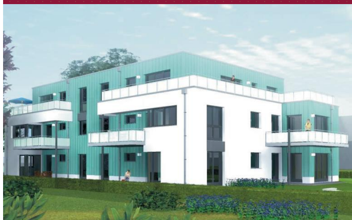
Nydamer Weg 13, 22145 Hamburg